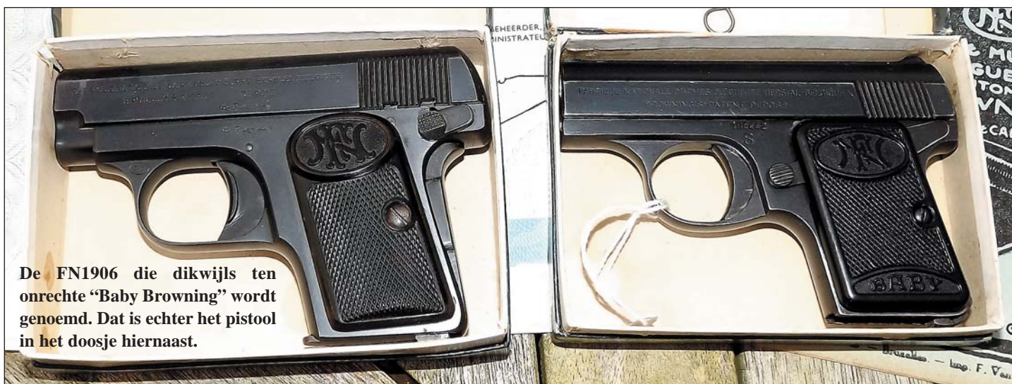
De FN1906 die dikwijls ten onrechte “Baby Browning” wordt genoemd. Dat is echter het pistool in het doosje hiernaast.