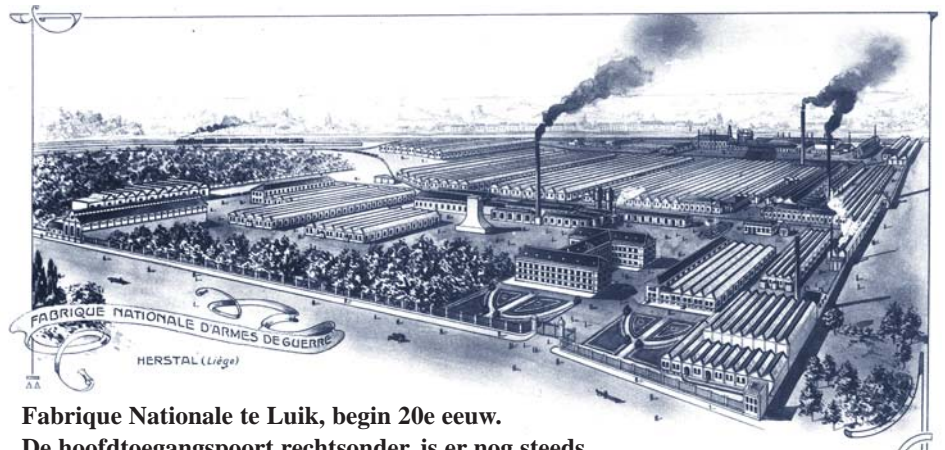
Fabrique Nationale te Luik, begin 20e eeuw. De hoofdtoegangspoort rechtsonder, is er nog steeds.