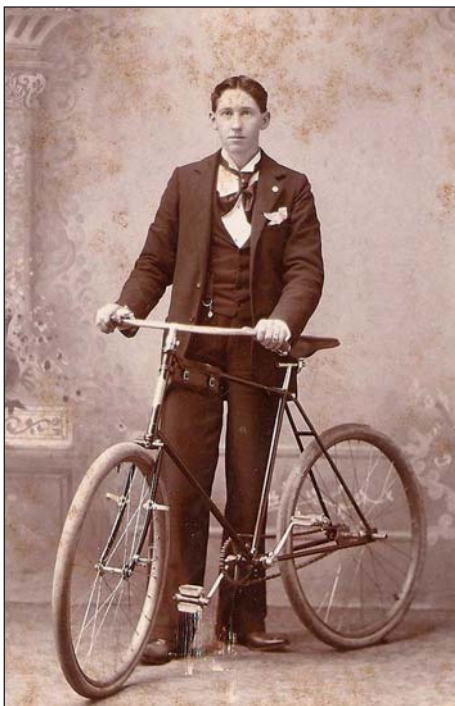
‘Ik ga een stukje fietsen, moeder.’ ‘Da’s goed, jongen. Als je je pistool maar bij je steekt. Je weet maar nooit.’

Omstreeks 1925 begon het FN1906 pistooltje soms wel eens een baby Browning genoemd te worden. U voelt de verwarring al aankomen.