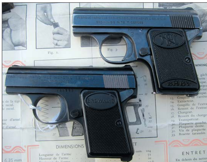
Dezelfde pistolen, verschillende merknamen. Zie tekst.

gekomen kunt u lezen in het artikel over het één miljoenste FN handvuurwapen (AK56 #116). Browning had het concept van pistolen, sleden en magazijnen al onder knie vóór 1895. Tegen 1900 had hij in België de nodige contacten en contracten lopen bij FN. Browning had echt een neus voor zaken en vooral voor het gat in de markt. Het idee van een repe-rend vestzakpistool zat al een tijdje in zijn achterhoofd te pruttelen. In 1905 maakte hij eigenhandig een prototype van wat later de FN 1906 zou gaan heten. In juni 1906 rolden de eerste vestzakpistooltjes reeds van de band. Het is ongelooflijk hoe snel en flexibel de productielijn van FN was. Gelijktijdig zijn er nog twee pistolen (Model 1900 en 1903) in productie samen met jachtwapens, Mauserkarabijnen, fietsen enzo-voort. Het is nauwelijks meer voor te stellen.